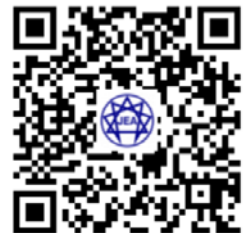
▲お問い合わせフォーム QRコード